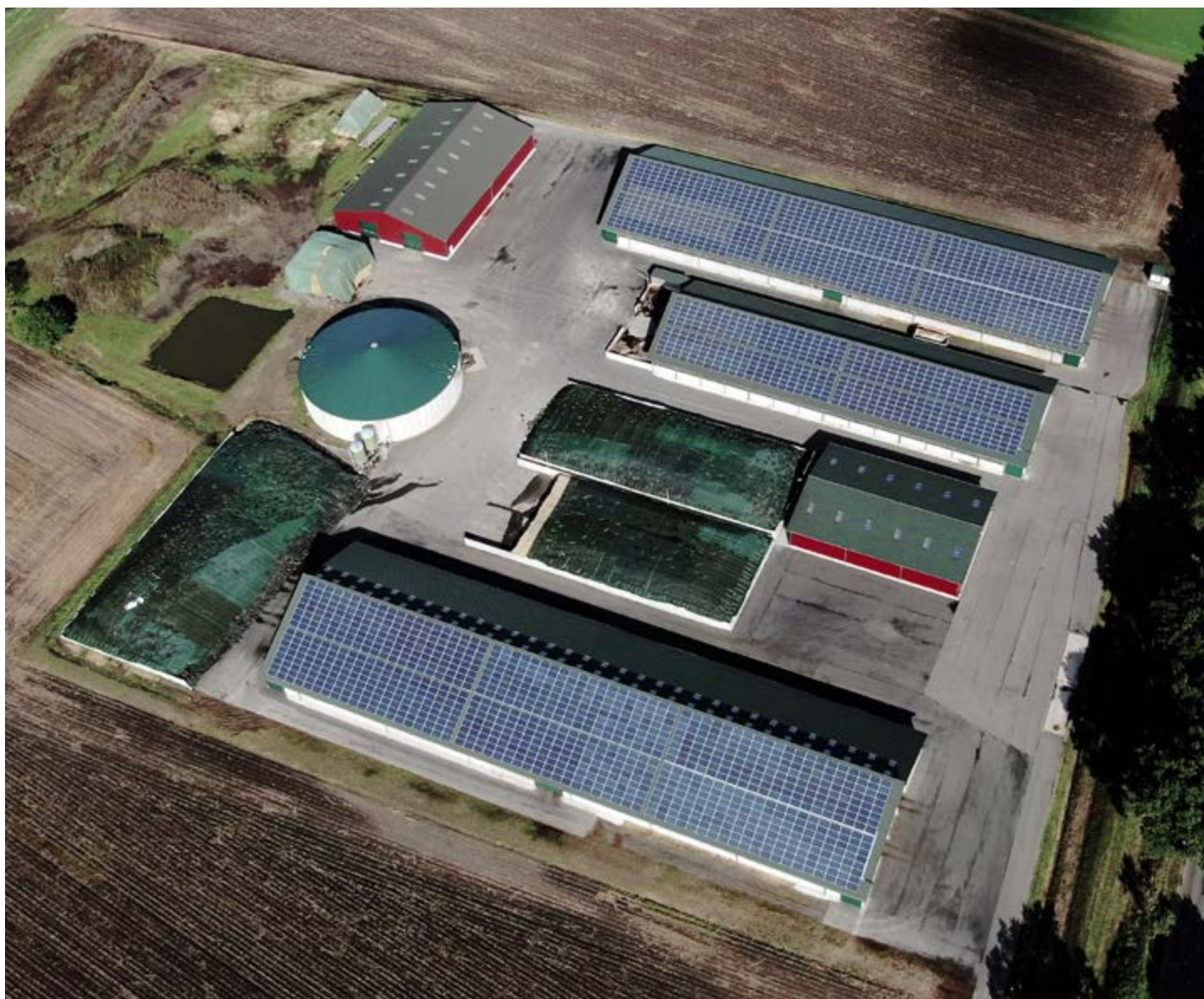
SUNFarm con un rendimiento de 669,76 kWp y 2392 módulos