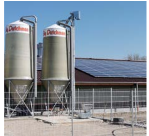
Rendimiento de la instalación: 99 kWp