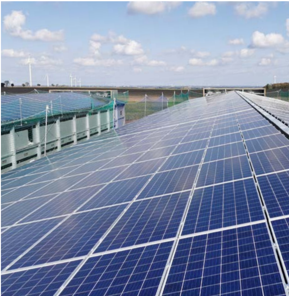
Rendimiento de la instalación: 749 kWp