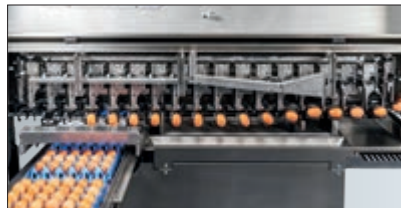
Sistema de carrusel horizontal para el transporte perfecto y el marcado seguro de los huevos