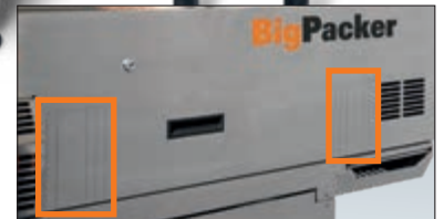
Lengüetas sobresalientes para utilización de impresora de inyección de tinta