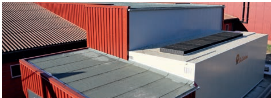
Instalación posterior del depurador de aire Porcus