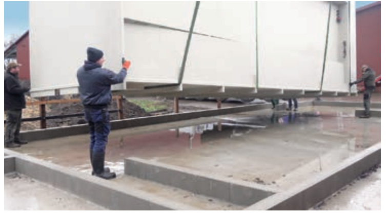
Porcus se coloca sobre la placa de suelo hormigonada