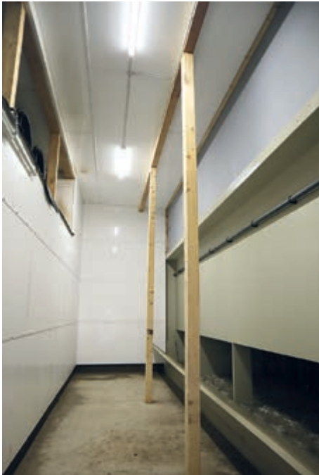
Pasillo de presión