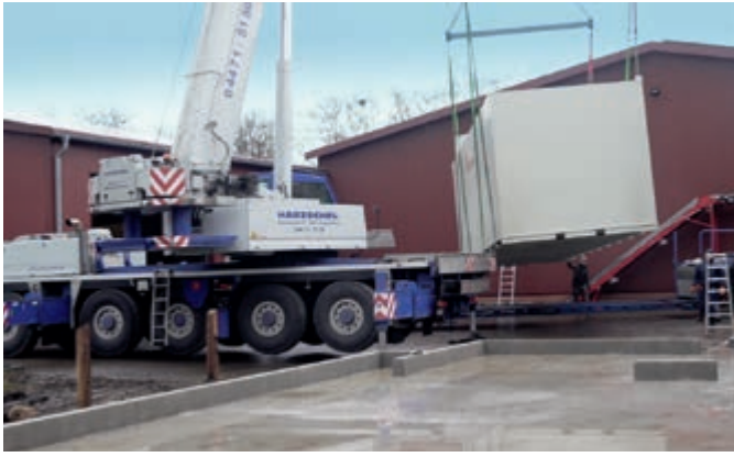
Una grúa eleva el depurador de aire Porcus de un remolque de plataforma baja