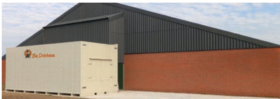
Porcus instalado en el frontal de una nave de engorde