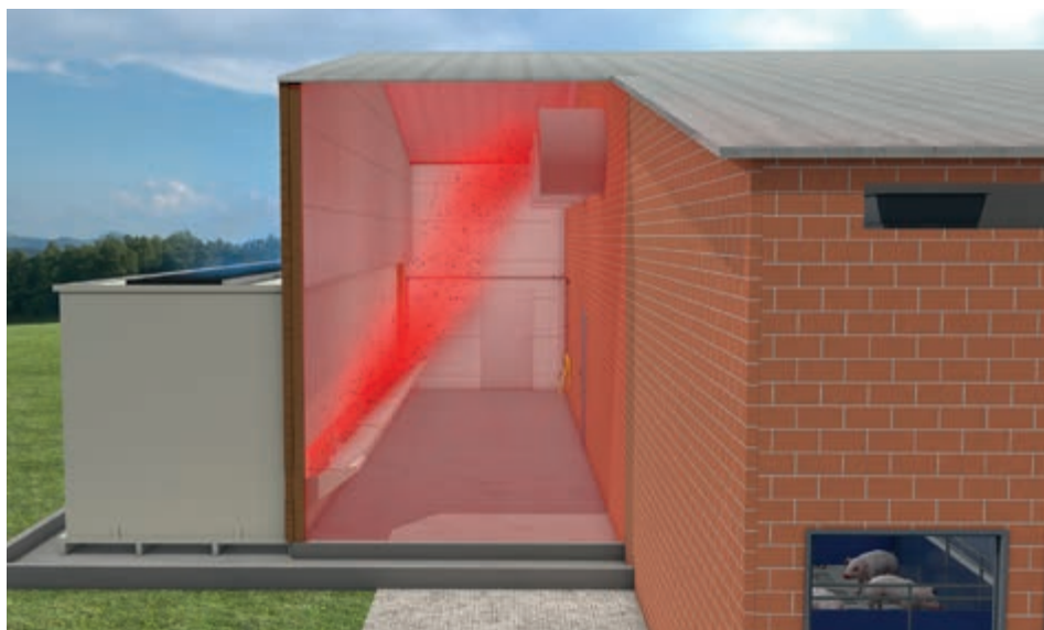
Vista del pasillo de presión

nitrógeno en el agua del proceso. A partir de una determinada concentración, una parte se bombea a un tanque de aguas residuales y se sustituye por agua fresca. El valor del pH del agua del proceso también se comprueba y se controla automáticamente. Un colector de goteo sirve de cierre superior del depurador y evita la salida de aerosoles.