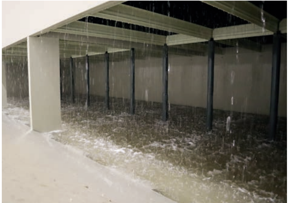
Depurador de aire Porcus en funcionamiento