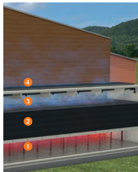
El aire de salida circula de abajo hacia arriba a través del paquete de filtro