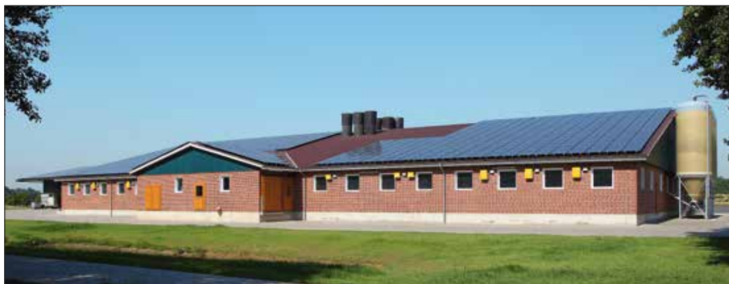
Granja terminada con 1800 lugares

B ig Dutchman proporciona equipos de alojamiento de cualquier tipo, para clientes en cualquier parte del mundo; desde la planta de alimentos hasta los cerdos de engorde listos para su sacrificio. El funcionamiento eficaz de nuestras instalaciones en todos los climas y bajo cualquier circunstancia está respaldado por décadas de experiencia y conocimientos técnicos.