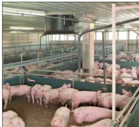
Alimentación líquida con HydroMix y con BigFarmNet

Dos de las principales ventajas del sistema de alimentación HydroMix son la precisión en la dosificación exacta en cada válvula de alimentación y la total flexibilidad del sistema lo cual nos permite encontrar la solución ideal para cada cliente.