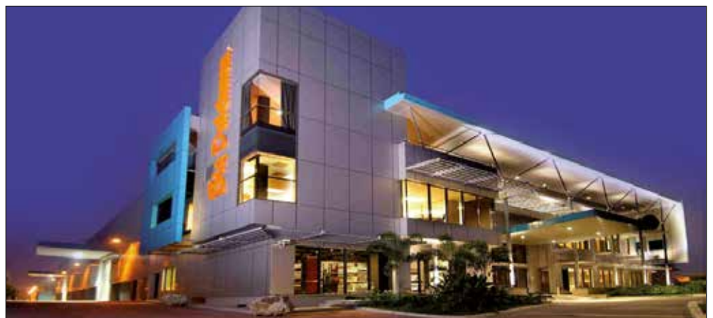
Big Dutchman Asia – sede central en Kuala Lumpur, Malaysia

Big Dutchman es símbolo de calidad, fiabilidad y buen servicio a nivel mundial. La tecnología innovadora, el constante desarrollo de productos para satisfacer los requisitos del mercado y las soluciones a problemas individuales de nuestros clientes son parte de una estrategia empresarial satisfactoria. Gracias a la proximidad de la empresa al mercado (Big Dutchman cuenta con distribuidores y vendedores en muchos países) se garantiza una red de servicio excepcional, que funciona correctamente.