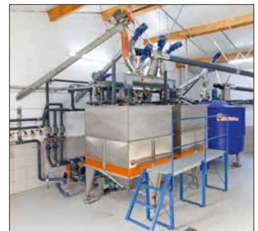
HydroMix – alimentación líquida controlado por ordenador

El sistema de Big Dutchman Hydromix de alimentación líquida es el sistema adecuado, especialmente para los productores que desean reducir los costos de alimentación, por una la alimentación de bajo costo de subproductos.