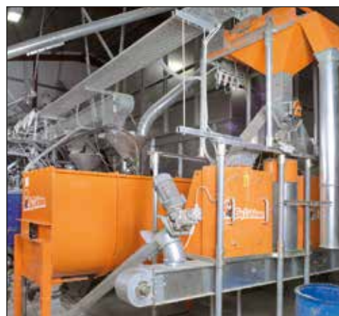
Cocina de alimentos con molino de alimentación, mezcladora y HydroMix

BigFarmNet es el completamente nuevo sistema de Big Dutchman de control y de gestión para cualquier tipo de producción porcina. El nuevo software es muy fácil de usar y muestra la misma interfaz del usuario para cada aplicación, ya sea en la producción, control del ambiente o de la evaluación de datos. Esto significa que usted es finalmente capaz de controlar su sistema de alimentación líquida, el clima de la vivienda y todas las tareas administrativas con un único equipo y software!