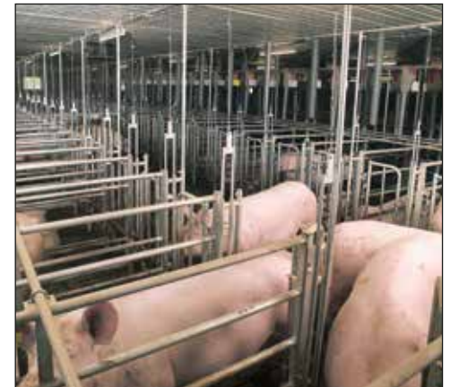
Establo de acceso libre "Easy Lock"

En el área de gestación, el alojamiento en grupo de cerdas se está volviendo más y más importante. Libre acceso a los establos permite que las cerdas entren y salgan de la cabina por su cuenta.