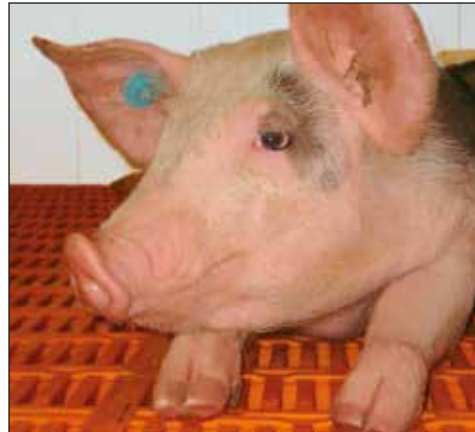
Vivienda moderna y equipos de alimentación

Para un manejo de cerdas exitoso se requiere de experiencia y, por supuesto, de las condiciones técnicas correspondientes. Big Dutchman pone las condiciones para una vivienda moderna y para sistemas de alimentación, por lo tanto puede proporcionar una base sólida para el éxito económico.