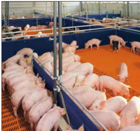
Alimentación líquida para la cría de lechones

La adecuada tecnología de alimentación es esencial para cada productor. DryRapid de Big Dutchman es un eficiente sistema de sonda de alimentación que es ideal para cerdas, para cerdos en crecimiento y cerdos de engorde. En combinación con los alimentadores automáticos PigNic y el PigNic-Jumbo es posible conseguir altas ganancias de peso diarias.