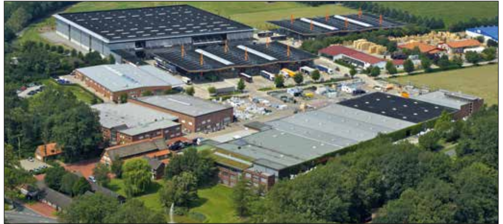
Big Dutchman International GmbH – la sede central de Big Dutchman en Vechta, Alemania

Hoy en día, Big Dutchman International es líder mundial en equipamientos para el manejo de aves y cerdos y está representado en más de 100 países. Las oficinas centrales de la empresa están ubicadas en Vechta (Alemania), para Europa Oriental, Occidental y oriente Medio, en Kuala Lumpur (Malasia), para Asia y en Míchigan (EE.UU.), para América del Norte y del Sur.