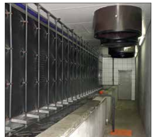
MagixX-P – la eficiente salida de lavado de aire

La reducción de emisiones de las instalaciones de producción ganadera se están volviendo más y más importantes. Con MagixX-P, Big Dutchman puede ofrecer a sus clientes una salida de lavado de aire altamente eficaz.