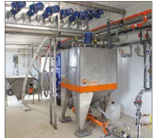
HydroAir – precisa alimentación líquida para lechón

Si a los lechones se les suministra con alimentación líquida, se recomienda instalar el sistema de alimentación HydroAir con sensor el cual permite producir pequeñas cantidades de alimento que luego pueden ser suministradas según se requiera y recién preparado.