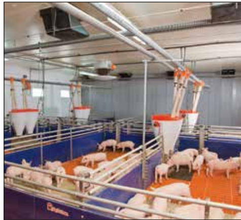
PigNic-Jumbo para la cría de lechones

Con equipamiento de última generación, Big Dutchman le proporciona todo lo que necesita para una moderna y exitosa producción porcina. No importa si se trata de un edificio nuevo, en remodelación, o la rehabilitación de un edificio antiguo, nuestros expertos encontrarán la mejor solución para sus necesidades.