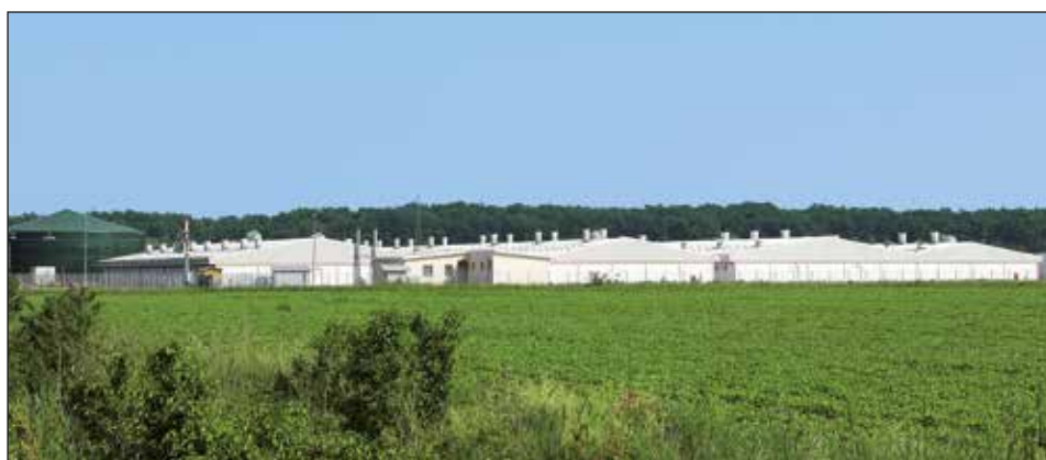
Farmkomplex Andrijaševci 1, Croacia, con 1500 plazas para cerdas

B ig Dutchman siempre ofrece la solución más adecuada para cualquier problema, tanto en el sur-oeste de China como en la helada Siberia. No hace distinciones dependiendo si el proyecto es de 100, 1,000, 10,000 o 50,000 cerdos: nuestros fiables y avanzados sistemas son siempre hechos a la medida para satisfacer las necesidades de nuestros clientes.