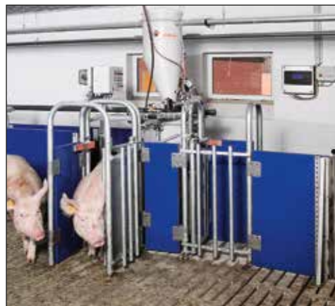
CallMatic pro – alimentación electrónica de cerdas

C allMatic pro es un sistema de alimentación para cerdas en cinta alojadas en grupo. Combina las ventajas de la agricultura amigable con los animales y la alimentación individual adaptándose a las necesidades de cada cerda de una manera ideal. La alimentación individual significa que el alimento se distribuye como va a siendo requerido de acuerdo a la condición de cada cerda. Los alimentos se pueden suministrar ya sea en líquido o en seco.