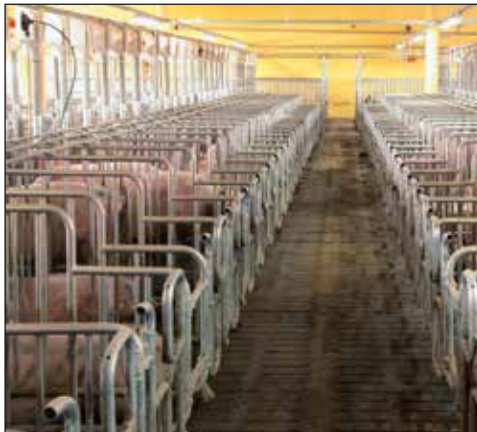
Centro de servicio con corrales separados de cerdo macho

Nuestra amplia gama de productos también incluyen la ventilación específica, la calefacción, la refrigeración y el sistema de tratamiento de aire de escape para las condiciones climáticas óptimas en cada vivienda porcina.