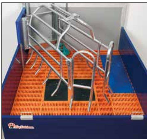
Corral de parto con suelos amigables para los animales

La computadora de la estación local puede ser instalada en el pasillo. Esto es para una mejor accesibilidad (zona libre de animales) y permite que el personal de servicio realice ajustes sin ser molestado.