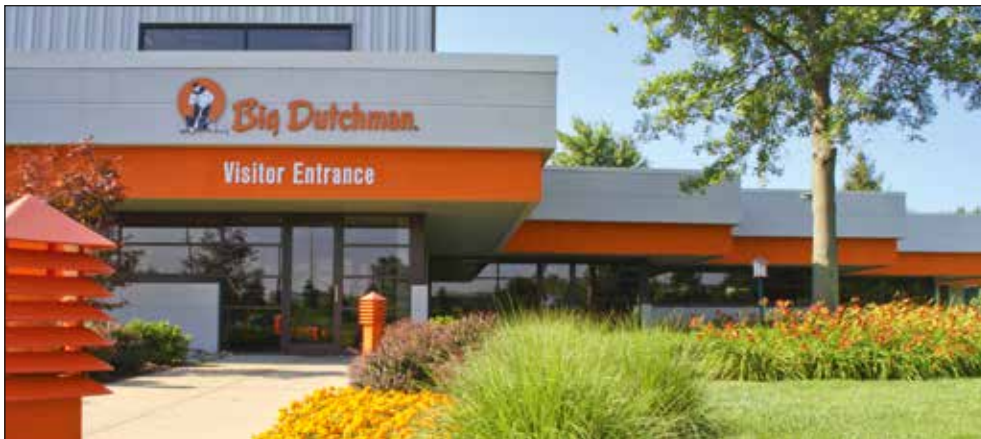
Big Dutchman Inc. – la sede norteamericana de Big Dutchman en Holland, Míchigan, EE.UU.

Big Dutchman emplea a más de 2000 personas alrededor del mundo. Alrededor de 250 ingenieros y técnicos están trabajando en mejorar y desarrollar aún más la ya existente gama de productos de Big Dutchman en todos los niveles. Una amplia gama de productos, personal de ventas con experiencia y continua mejora de los conocimientos técnicos son una de las piedras angulares del éxito de la compañía.