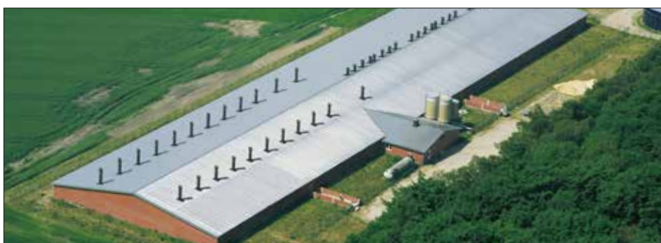
Granja Garther Heide en Alemania con 2000 plazas para cerdas

N o dude en contactarnos en cualquier momento para obtener más información o para una consulta detallada.