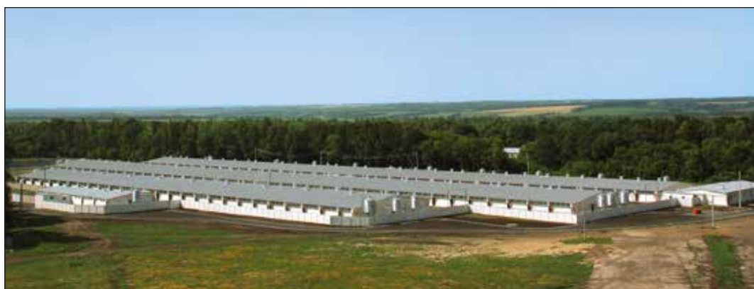
Farmkomplex Rakitianskij en Belgorod, Rusia, con 4800 plazas para cerdas

E l futuro siempre nos plantea nuevos retos, los cuales solucionaremos juntos con y para nuestros clientes en todo el mundo. Con esto en mente, tenemos la intención de fortalecer y ampliar aún más nuestra posición como reconocido líder del mercado.